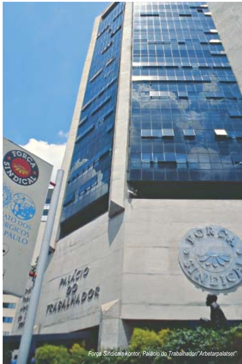
Força Sindicals kontor, Palácio do Trabalhador/"Arbetarpalatset"