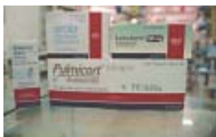
Några av Astrazenecas brasilianska produkter.

Men kamp och klagomål förekommer inte. Folk är för rädda och vill hellre ta chansen att få behålla sitt arbete, än att de klagar på de problem som finns, fortsätter han.