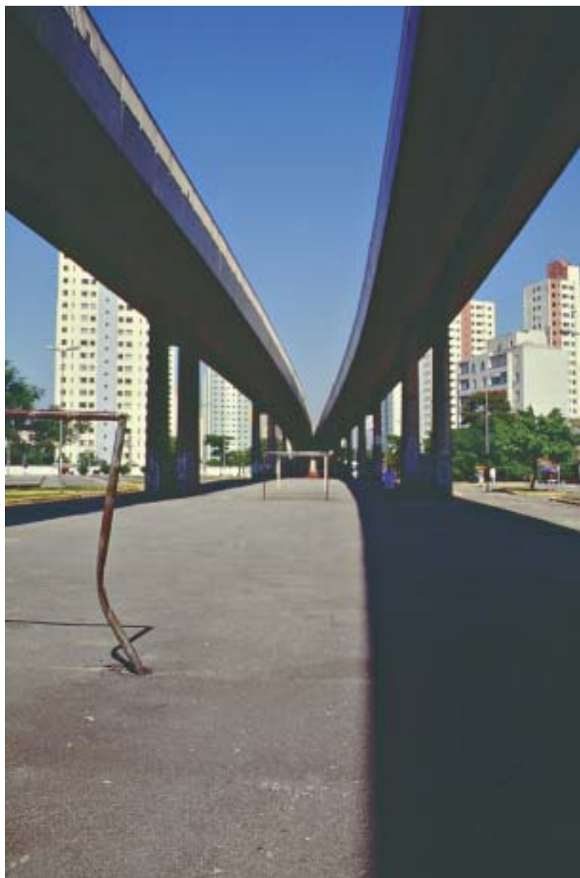
Vägval i São Paulo.