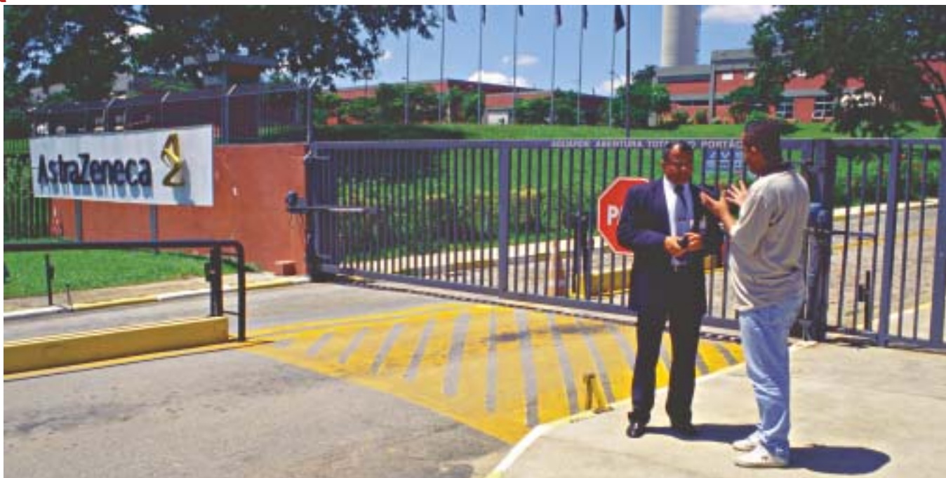
Facket blir bortkörda av en vakt från Astra Zenecas läkemedelsfabrik, utanför Sao Paolo, Brasilien.