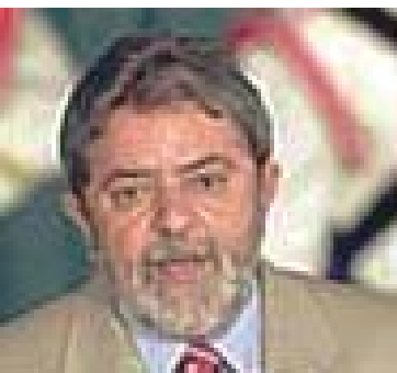
President Luiz Inácio "Lula" da Silva.

Brasiliens nyligen valda president, Luiz Inácio "Lula" da Silva, började en gång sin karriär som fackföreningsledare i just São Bernardo do Campo. Där var han med om att organisera arbetarna på olika