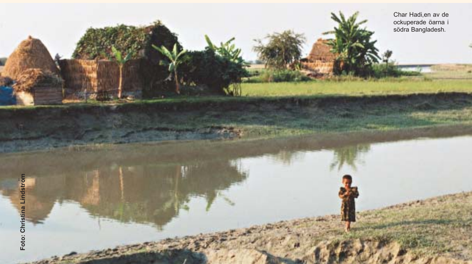
Char Hadi, en av de ockuperade öarna i södra Bangladesh.