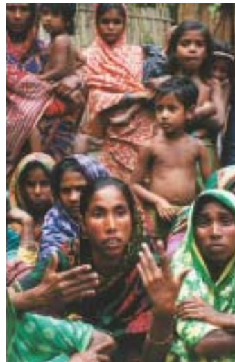
Kvinnomöte i Kurigram.

Nästan alla vi träffar i norr är daglönare. De får gå till jordägaren och be om jobb på fälten. Kvinnorna betalas 15 eller 20 taka om dagen (tre eller fyra kronor)