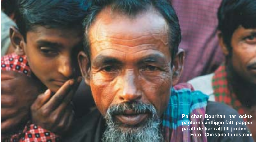
På char Bourhan har okkupanterna antligen fått paper på att de har rätt till jorden.

ringsprocessen är klar, är mänskorna glada. Det är som om ett oklyfts från deras axlar.