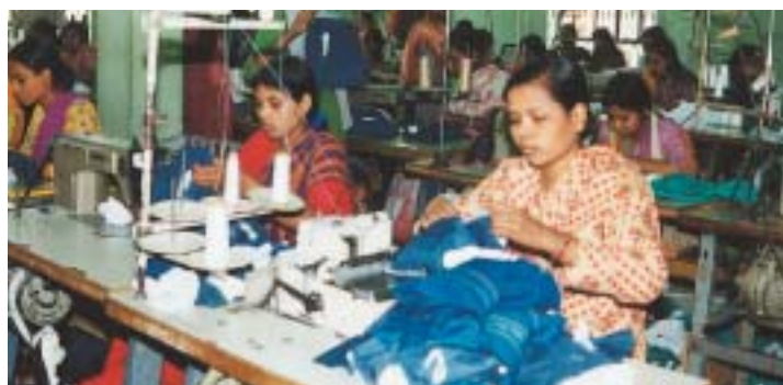
Kvinnliga klädarbetare i Dhaka, Bangladesh. Bilden är dock inte från Debonaires fabrik.

oregelbundet men – enligt arbetarna – är ledningen alltid förvarnad.