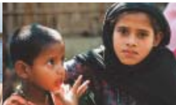
Trots alla problem så har folket på öarna det bättre nu än innan ockupationerna.