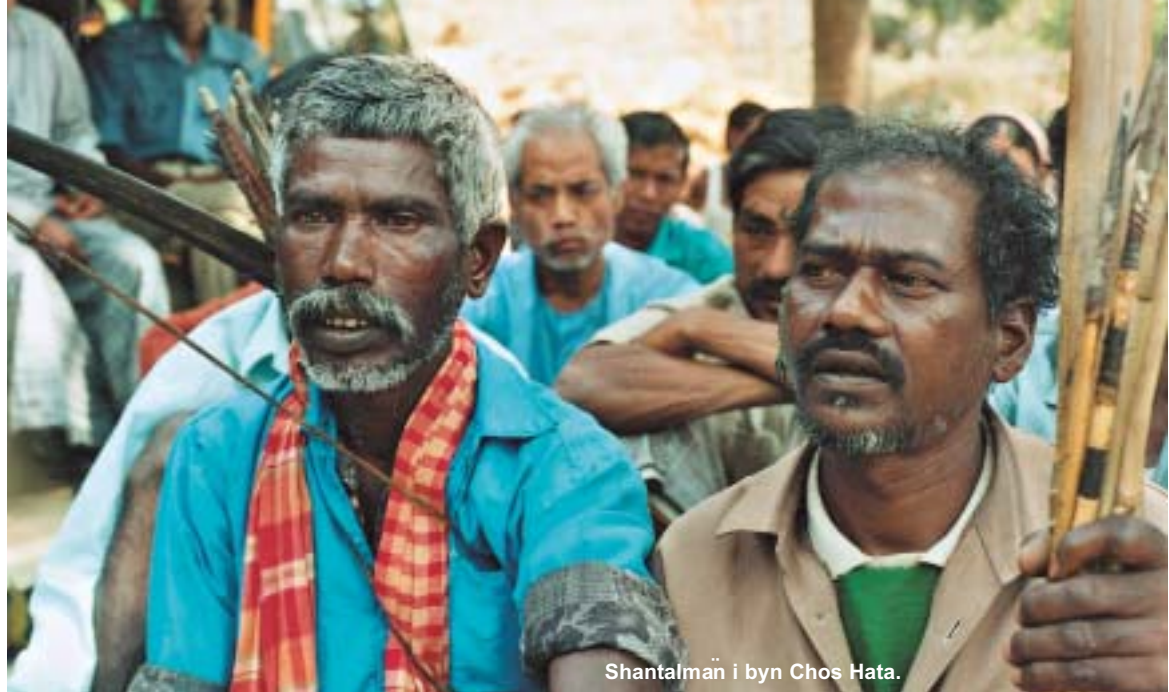
Shantalman i byn Chos Hata.