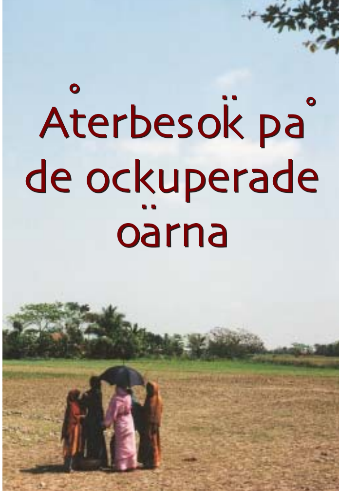
På char Hadi har träden vuxit sig stora sedan de planterades i början av ockupationen.

Nej, istället ser det ut som om myndigheterna förhalar processen.